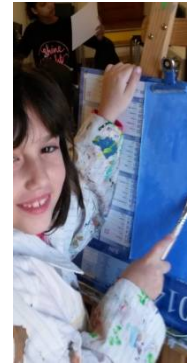
Instants de bonheur dans l'atelier !