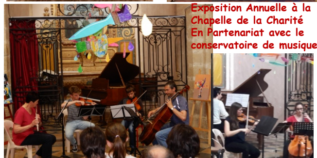
Exposition Annuelle à la Chapelle de la Charité En Partenariat avec le conservatoire de musique