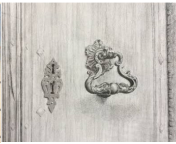
Mine de graphite