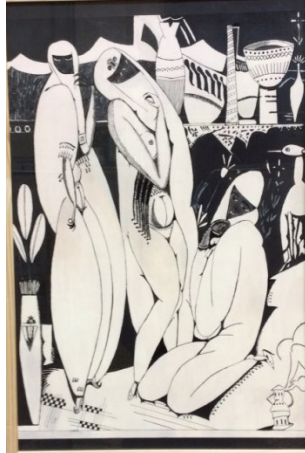
Acrylique et encre de chine