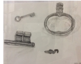
Mine de graphite