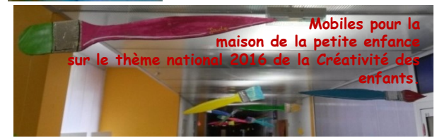
Mobles pour la maison de la petite enfance sur le thème national 2016 de la Créativité des enfants.