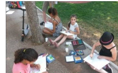
Dessin peinture in situ au Parc de l'Europe

L'expérience acquise au fil des années, l'implication dans la vie culturelle de la ville de Pertuis, le travail avec les artistes contemporains, constituent une richesse qu'elle partage avec tous ses élèves. Son enseignement repose sur les bases classiques du dessin pour acquérir progressivement de nouvelles techniques ( aquarelle, pastel, encre, acrylique, alkyde, modelage, collage, techniques mixtes... ) tout en respectant la créativité de chacun. Dans une ambiance sereine les apprentissages se déroulent selon le rythme et la personnalité de chaque élève.